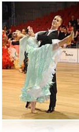
Rimini 2009 Campionati Italiani FIDS