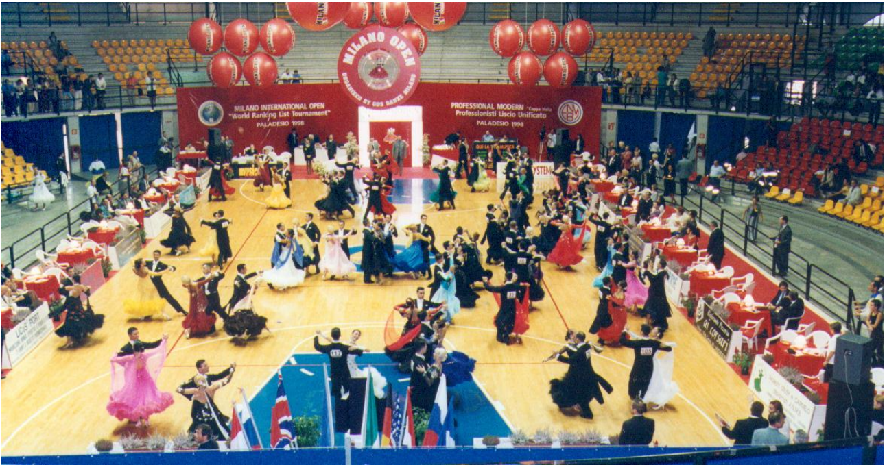
La grande famosa competizione Milano Open